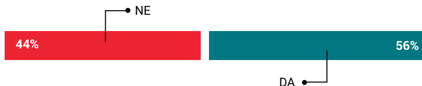
Grafikon 4. Poteškoće u saradnji mreža sa lokalnom samoupravom

One mreže koje jesu naišle na poteškoće, na prvom mestu navode nezainteresovanost i zatvorenost institucija. Ovo su potvrdili i učesnici konsultacija. Među ostalim teškoćama mreže navode i neprepozavanje uloge OGD i njihovih kapaciteta da doprinesu unapređenju stanja, nepoverenje prema OGD, kao i nedovoljno razvijene kapacitete donosilaca odluka i službenika. Jedna učesnica konsultacija je to objasnila ovako: