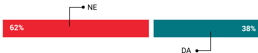
Grafikon 3. Poteškoće u saradnji mreža sa državnim institucijama